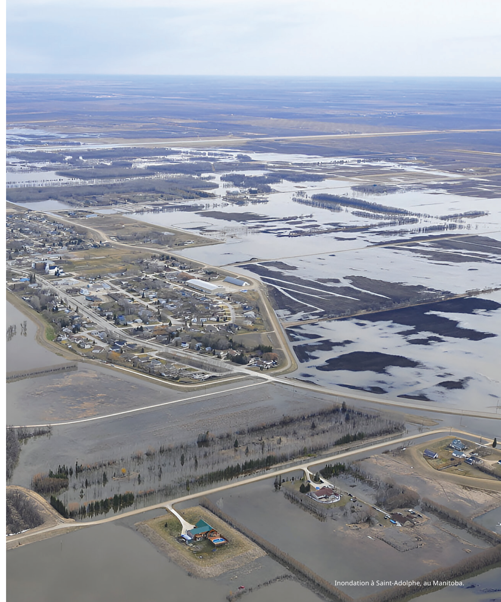
Inondation à Saint-Adolphe, au Manitoba.