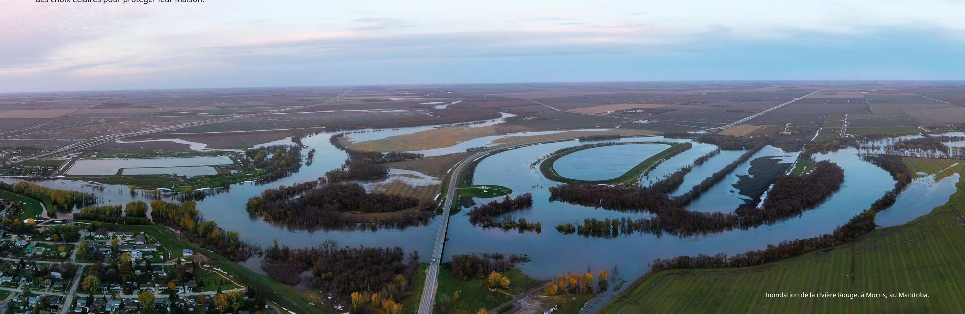
Inondation de la rivière Rouge, à Morris, au Manitoba.

Des plaines inondables sont des basses terres adjacentes à des rivières et à des cours d'eau sujets à des inondations répétées. Pendant des millénaires, les inondations ont déposé des sols et des nutriments dans le paysage, créant des zones planes idéales pour l'agriculture et l'établissement de collectivités. Toutefois, les terrains situés dans une plaine inondable sont exposés à des risques d'inondation accrus.