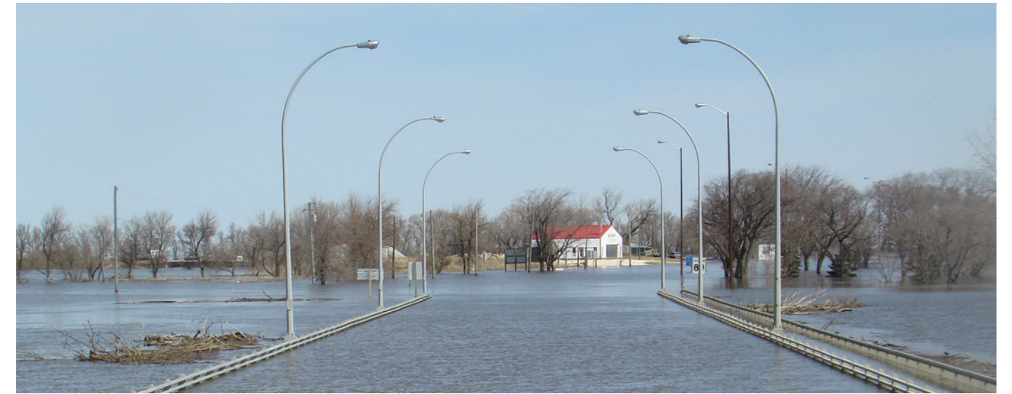
Eaux de crue submergeant un pont dans la ville de Morris, au Manitoba.

Selon les exigences locales en matière de location résidentielle, il est possible qu'il appartienne au propriétaire des lieux de corriger tout problème lié au logement. Même si vous ne pouvez pas entreprendre de projets d'atténuation, vous pouvez tout de même réduire l'ampleur des dommages causés par les inondations en conservant vos objets précieux et vos documents importants ailleurs qu'au sous-sol ou, du moins, à un endroit surélevé. À la page suivante, vous trouverez des projets à coût réduit ou sans coût.