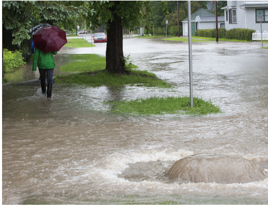
Une rue résidentielle inondée par un refoulement d'égout.

Les crues éclair peuvent survenir rapidement et le délai d'avertissement risque d'être très court. Les crues éclair sont surtout causées par la pluie, mais elles peuvent aussi être provoquées par des embâcles de glace ou par le bris d'une digue ou d'un barrage.