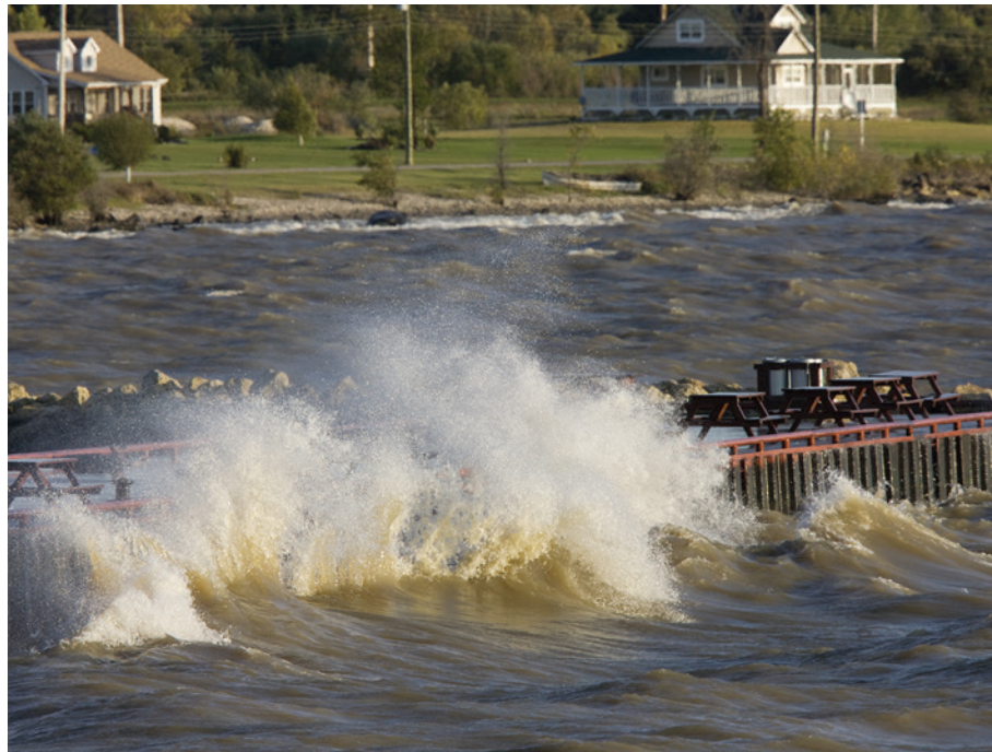
Des vagues déferlant sur un quai au lac Winnipeg, au Manitoba.

Ces inondations sont généralement associées aux océans (comme le long de la baie d'Hudson dans le nord du Manitoba), mais des inondations côtières causées par des ondes de tempête se produisent aussi sur les rives des grands plans d'eau, comme le lac Winnipeg et le lac Manitoba.